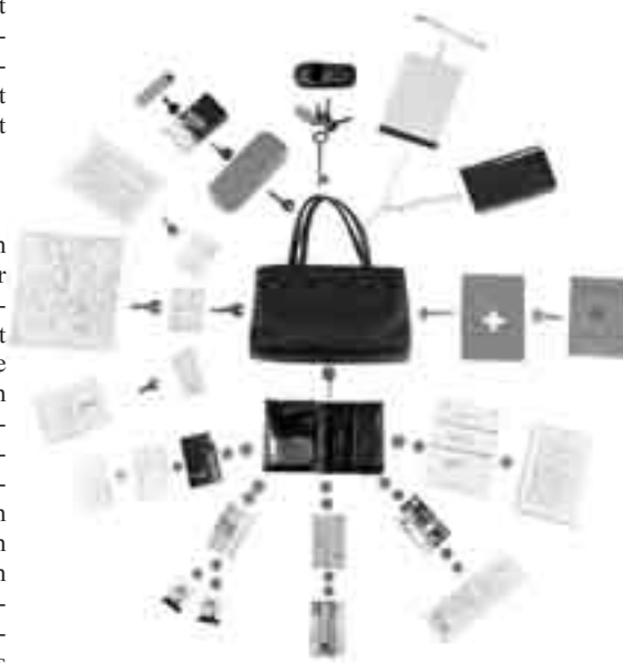
Gedächtnissystem für Handtasche: Schlüssel, Portemonnaie, Fahrscheine, Pass, Natel, Ausweise, Reisehilfen, Schreibzeug ILLUSTRATION: ANNIK TROXLER

Der Fähigkeit unseres Geistes soll also gefördert werden. Nehmen wir das Bei-