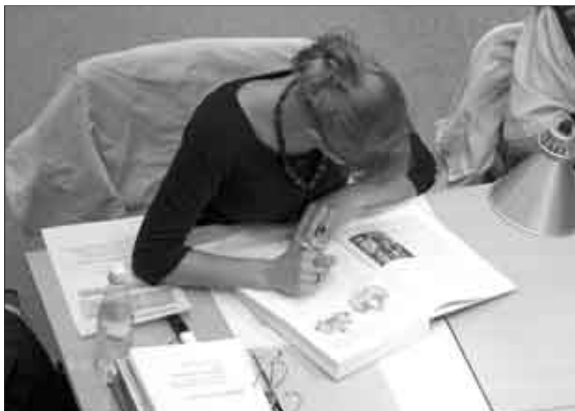
Büffeln oder nicht büffeln, das ist hier die Frage.

Oder man macht es so wie ein Studienkollege von mir, der gewisse Vorlesungen teilweise gar nie besucht, sich das Skript ausleiht, im Internet ein Foto des Dozierenden anschaut, damit er die richtige Person um eine Unterschrift im Testatheft bittet, und dann nach ein paar intensiven Nachtschichten die Prüfung auf Anhieb besteht. Kluger Kopf? Fauler Sack? Brillantes Skript? Zu einfache Prüfung? Wie auch immer: Das Beispiel zeigt, dass Präsenzzahlen halt nur die halbe Miete sind. Was viel mehr zählt, ist, was in den Köpfen ist. Und das lässt sich nur schwer messen. Nur Disziplin macht noch keine guten Studierenden, und hohe Präsenzzahlen keine guten Veranstaltungen.