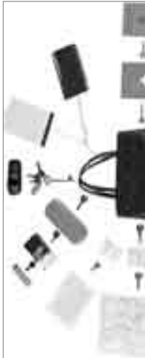
Techniken gegen das Vergessen

Adressänderungen bitte wie folgt melden. Studierende: Universität Bern, Immatrikulationsdienste, Hochschulstr. 4, 3012 Bern Angestellte: per Mail an: sub@sub.unibe.ch