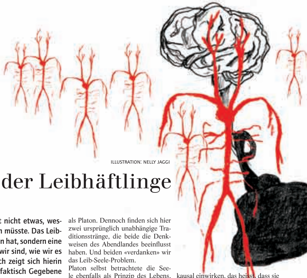
ILLUSTRATION: NELLY JAGGI