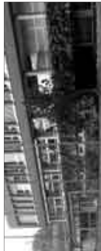
Das Sportsstudium boomt