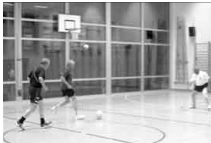
Dozierende bleiben auch im Alter am Ball

stand deswegen darin, das alljährliche Orientierungsschreiben neu auch an die Angestellten der Universität zu adressieren. Ein Jahr später wurde für die Angestellten sogar ein eigener Brief aufgesetzt. Als Folge davon weist die Schlussstatistik des Jahres 2003/04 die Zahl von 615 verkauften Unisport-Ausweisen auf. Das entspricht beinahe einer Verdoppelung gegenüber vor zwei Jahren. Reto Zimmermann spricht von einem «durchschlagenden Erfolg auf