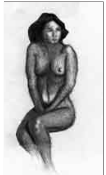
ILLUSTRATION KATHARINA BHEND