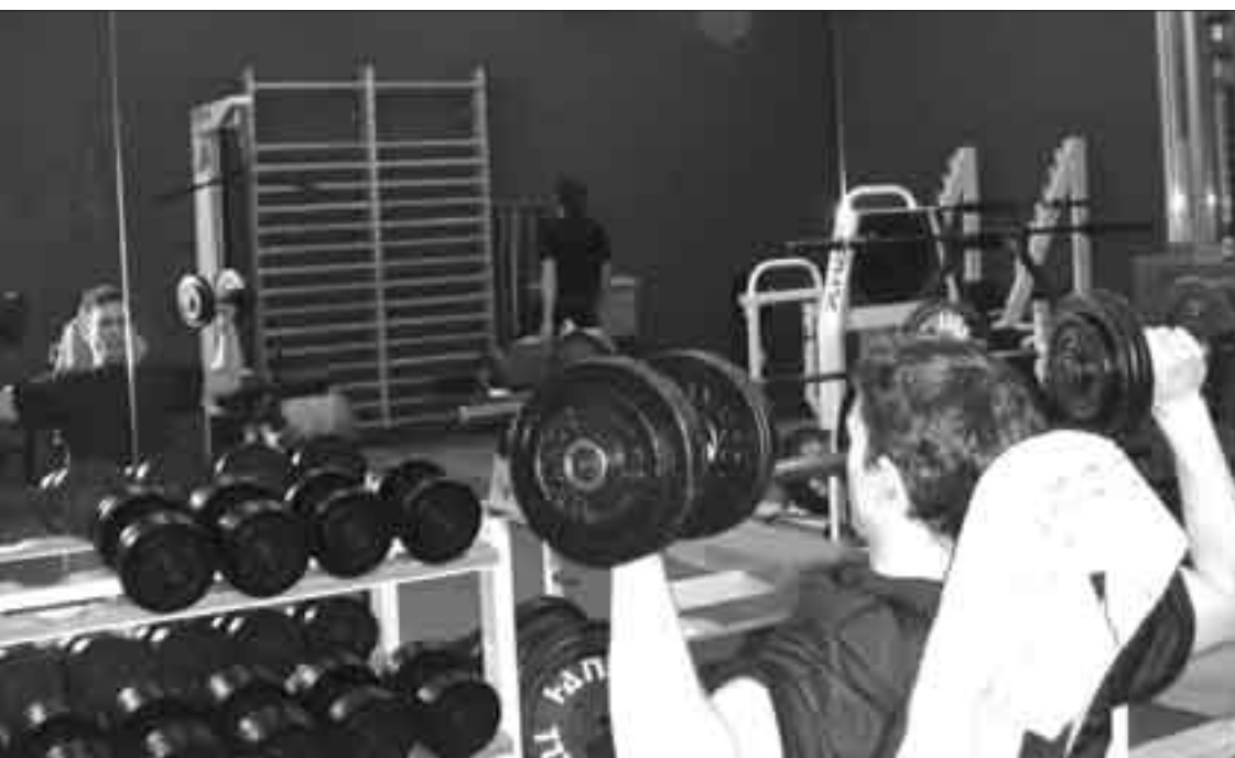
Entdeckungsreise zu den Muskelmännern: Ein Studi trainiert im Krafraum des ISSW.

SABINE HOHL SABINE_HOHL@STUDENTS.UNIBE.CH MIT UNTERSTÜTZUNG VON MARA LEHMANN