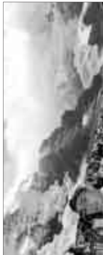
Eine Besessene gewährt Einblicke

Adressänderungen bitte wie folgt melden. Studierende: Universität Bern, Immatrikulationsdienste, Hochschulstr. 4, 3012 Bern Angestellte: per Mail an: sub@sub.unibe.ch