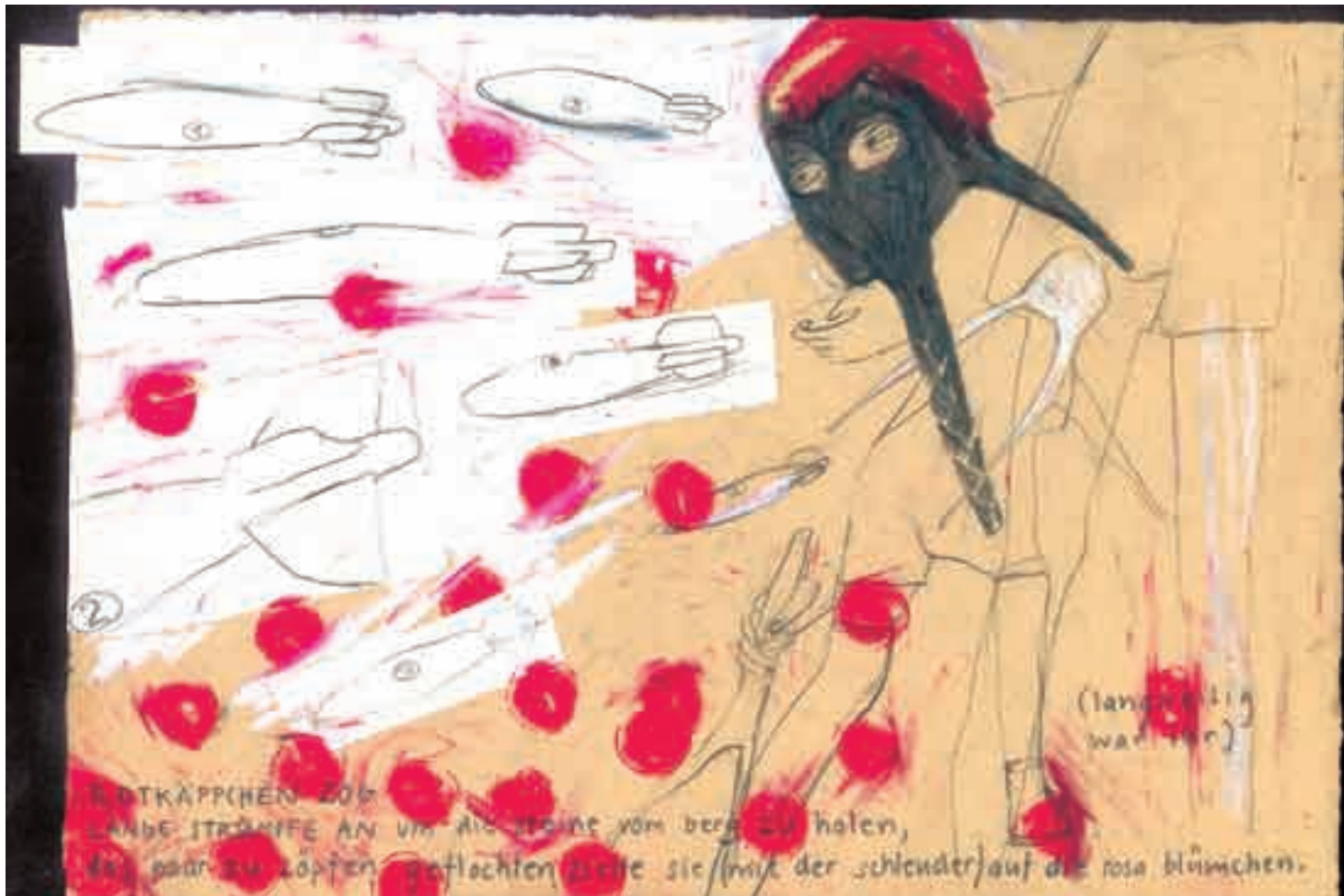
ILLUSTRATION: ALEXANDRA UND JULIA STEINER

oder Einzahlung auf pc: 30-3997-5 mit Vermerk «unikum-abo»