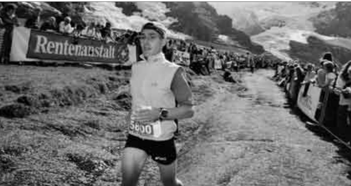
Das subjektive Erleben von Schönheit liegt in der Intensität des Moments