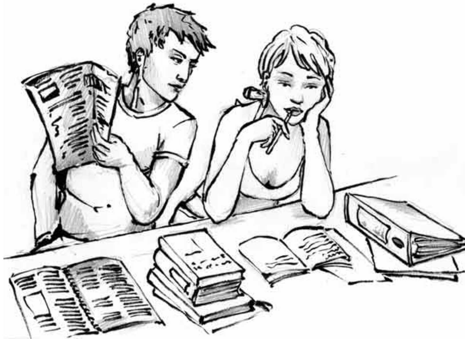
«Der Lenz ist da» – wer sagt, das StudentInnen nur lernen können?

Klar ist, dass nicht alle Menschen gleich empfindlich auf die Einflüsse der wärmeren Jahreszeit reagieren. Und daraus folgt unweigerlich auch, dass nicht alle in gleichem Masse empfänglich sind für die