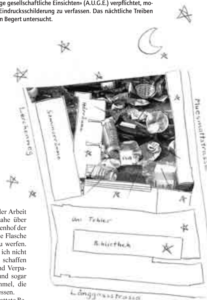
ILLUSTRATION: ANDREA SIGNER

Ich stellte mir wüste Szenen vor, Horden junger Männer, stockbesoffen und bekifft, torkelend oder am Boden liegend, Bierflaschen werfend und sich mit Essen vollstopfend. Keine Zweifel, ich musste nachts dorthin. Da es mir zu riskant erschien, mich alleine als Frau an den Tatort vorzuwagen, erklärte ich meinem Kollegen Kurt die Situation. Dass ich schon seit längerem ein Auge auf ihn geworfen hatte, verschwieg ich hingegen. Als echter Gentleman erklärte er sich sofort bereit, mich zu begleiten.