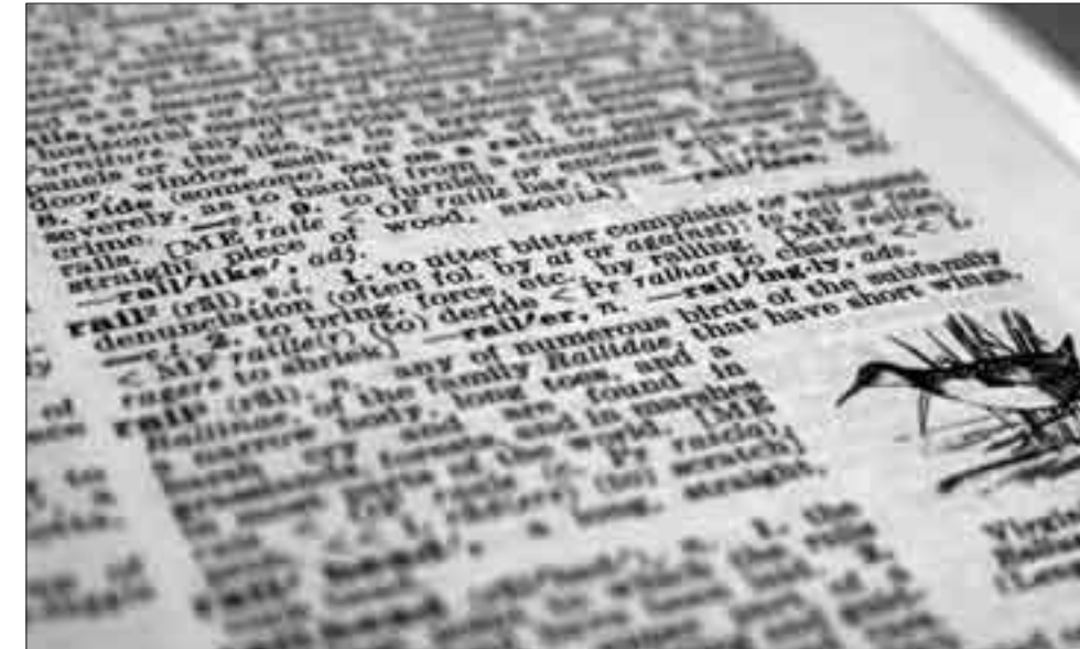
Englisch suggeriert Internationalität, auch wenn diese gar nicht vorhanden ist.