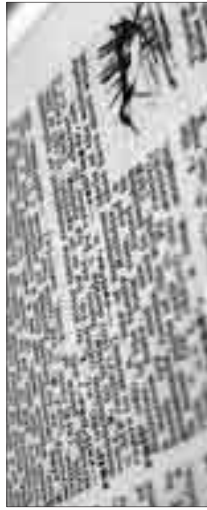
Anglizismen prägen unseren Alltag

Adressänderungen bitte wie folgt melden. Studierende: Universität Bern, Immatrikulationsdienste, Hochschulstr. 4, 3012 Bern Angestellte: per Mail an: sub@sub.unibe.ch