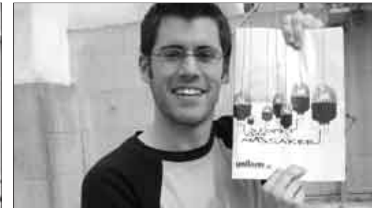
...bis vorne: Die Uni soll kritisch beleuchtet werden