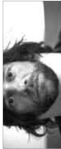
Steckt eure Nase rein...