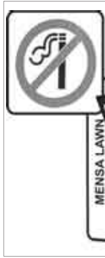
Das Rauchen in der Mensa wird verboten